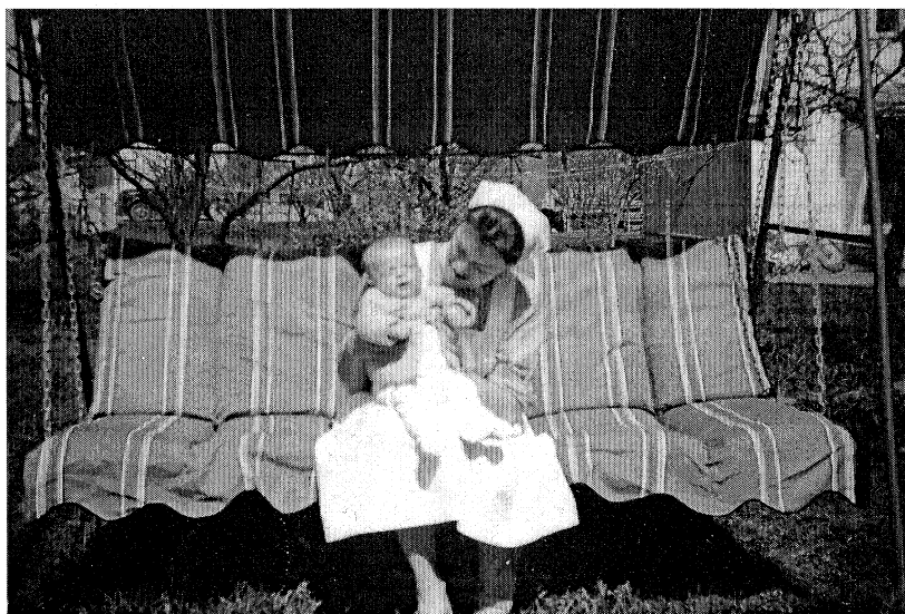
En barnepleier med et spedbarn som var på fødehemmet til det ble adoptert.