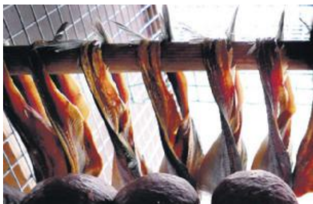
SILD: Her heng silda til tørk for å bli til boknasild.